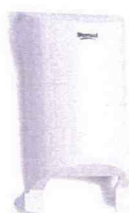
Art nr 4594